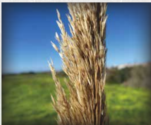
La tête florale de la canne de Provence.