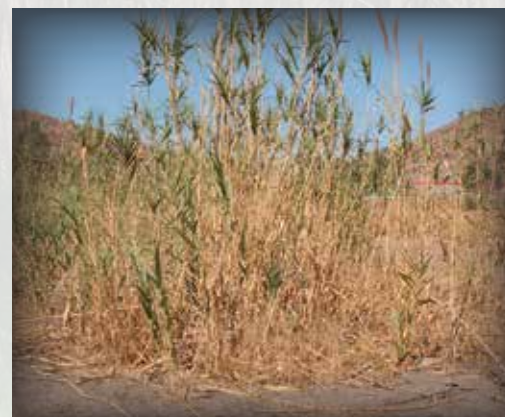
Les tiges, feuilles et gaines de la canne de Provence.

Les plantes envahissantes sont des espèces végétales qui peuvent être nuisibles lorsqu'elles sont introduites dans de nouveaux milieux. Ces espèces peuvent envahir les milieux agricoles et naturels, causant ainsi des dommages importants à l'économie et à l'environnement du Canada. Pour en savoir plus, visitez le www.inspection.gc.ca/envahissantes ou écrivez au Programme des espèces exotiques envahissantes de l'ACIA à l'adresse suivante : cfia.ias-eee.acia@canada.ca .